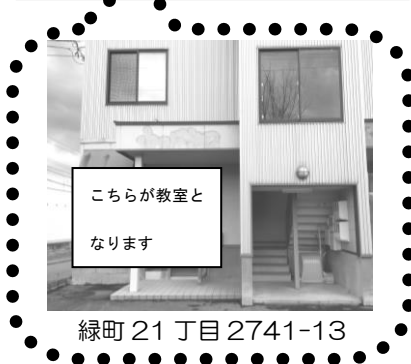
緑町 21 丁目 2741-13